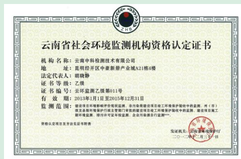
云南环保厅资格认定证书